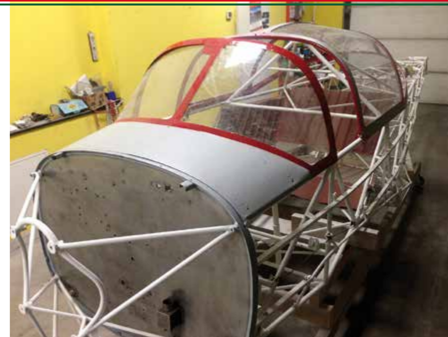
La splendida fusoliera in traliccio di acciaio saldato