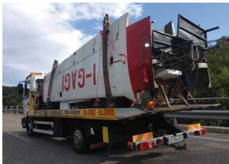
Fusoliera e ali di I-GAGI durante il trasporto in officina

100 hp che assicurava una velocità massima di 210 km/h e un'autonomia di 660 km. Nel '64 ne fu prodotta una versione dedicata al traino alianti denominata 19R, versione che però si limitò alla produzione dell'unico esemplare I-MARM. In questo caso il motore fu un Lycoming O-320 da 150 hp che assicurava una velocità massima di 240 km/h. In realtà nel 2005 l'esemplare I-SUSJ del 1961 è diventato il secondo Scricciolo con motorizzazione superiore ai canonici 100 hp. Restaurato e certificato come costruzione amatoriale (e con le nuove marche I-FLEA), monta un Lycoming O-320-E2A da 160 hp. E anche questo aereo è in flotta HAG! Quanto all'I-GAGI se qualche lettore dovesse averci volato e avesse voglia di condividere con noi i suoi ricordi o qualche immagine, ci scriva senza indugio a info@hag-italy.com