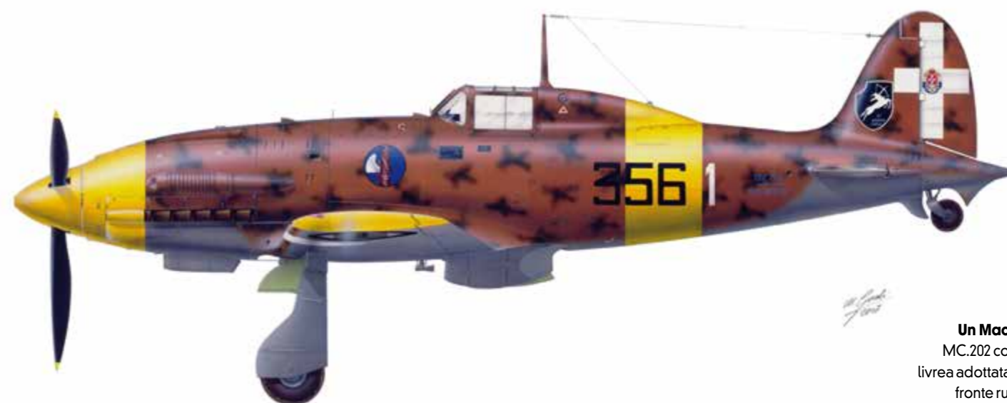
Un Macchi MC.202 con la livrea adottata sul fronte russo